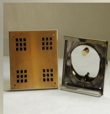
RXP ( )