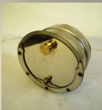
RX ( )