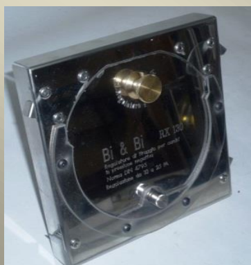
RXC ( )

Il regolatore di tiraggio automatico, o detto anche limitatore di tiraggio, è costituito da una portina indotta a muoversi per differenza delle pressioni interne ed esterne al camino. La portina appoggia su due perni detti a corda, come nelle bilance di grande precisione.