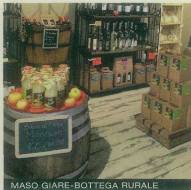
MASO GIARE-BOTTEGA RURALE