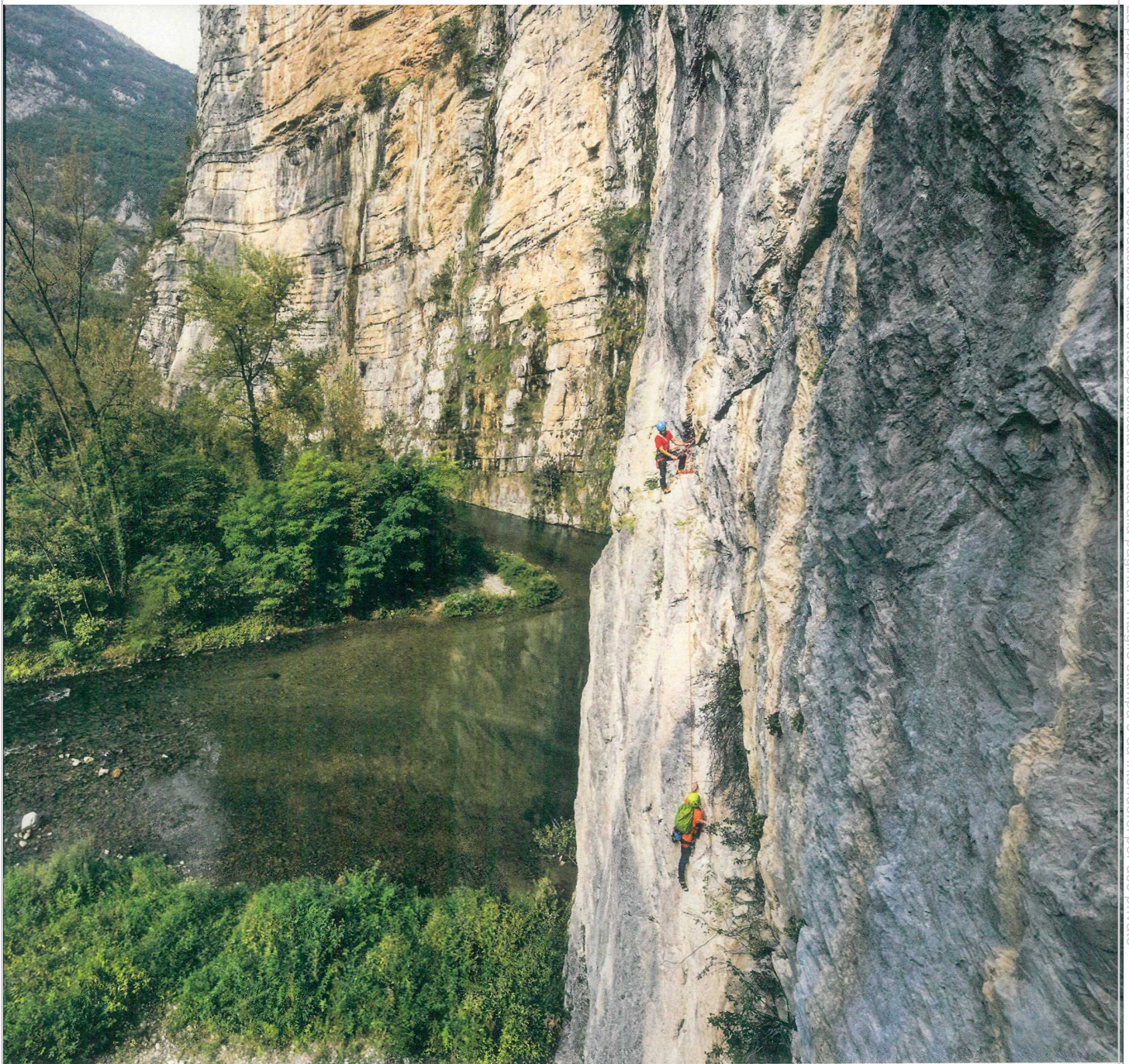
La proprietà intellettuale è riconducibile alla fonte specificata in testa alla pagina. Il ritaglio stampa è da intendersi per uso privato