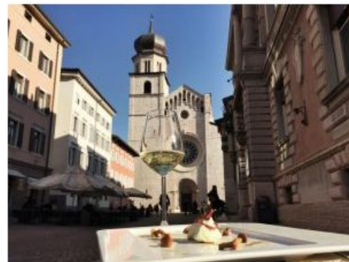
Processed with Snapseed.

Importante esempio di architettura manierista e sede dell'Enoteca Provinciale del Trentino , Palazzo Roccabruna omaggerà la zona di Trento e le bollicine di montagna Trentodoc . Dopo la visita guidata, si potrà degustare un Trentodoc a scelta tra quelli di Agraria Riva del Garda , Azienda Agricola Balter , Azienda Agricola Francesco Moser , Cantina Aldeno , Cantina di Isera , Cantina Endrizzi ,