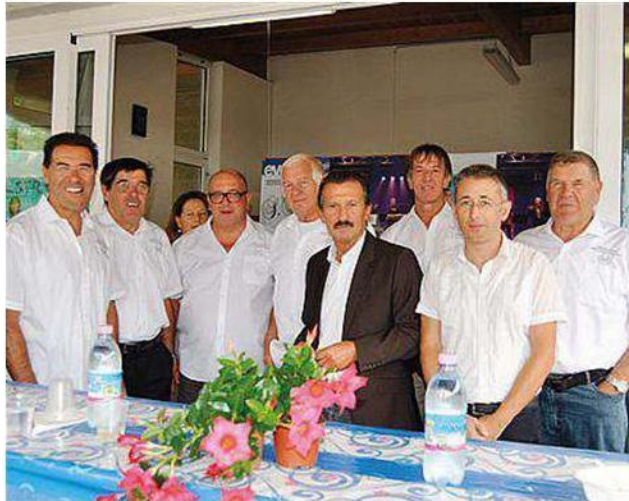
A S.Alessandro è tutto pronto per la tradizionale sagra

la raccolta differenziata resa possibile grazie al sostegno del Comune di Riva e della Comunità di Valle Alto Garda e Ledro. (m.cass.)