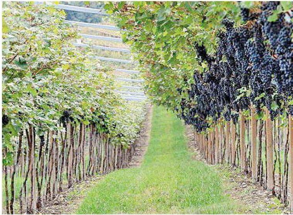
Dopo l' "annus horribilis" 2014, le prospettive per la vendemmia sono ottime per quantità e qualità

La proprietà intellettuale è riconducibile alla fonte specificata in testa alla pagina. Il ritaglio stampa è da intendersi per uso privato