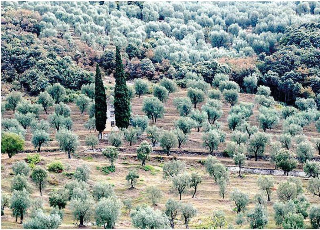
La siccità di questa estate torrida sta mettendo a dura prova gli olivi del monte Brione

La proprietà intellettuale è riconducibile alla fonte specificata in testa alla pagina. Il ritaglio stampa è da intendersi per uso privato