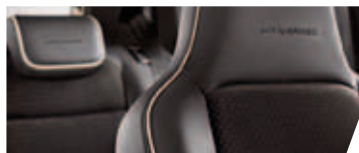
SEDILI IN ALCANTARA

Con il suo design unico, Nuova Mii by MANGO è la citycar ideale. Fuori glamour: look contemporaneo, cerchi in lega da 15" in contrasto e specchietti cromati. Dentro fashion, con dettagli chic come le cuciture beige ed un appendiborsa davvero smart. Perché il design conta. E nella Nuova Mii by MANGO lo stile è di serie, da 10.350 €.