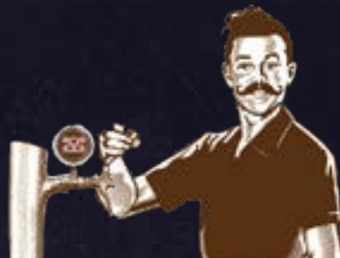
Birre alla SPINA