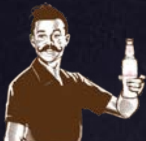
Birre in BOTTIGLIA